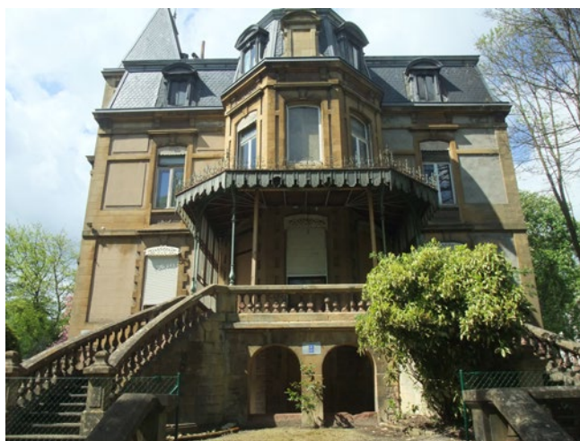
Villa Avenue Marie-Thérèse

Eyschen encouragea la création de quartiers bourgeois cernant le centre historique de la ville, tels que les lotissements «au-delà du parc», «derrière la Fondation Pescatore», du front de la plaine et du plateau Bourbon 15 .