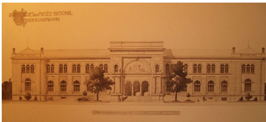
Monument au poètes Dicks et Lentz

de ce beau paysage que nous avons toujours cherché à obtenir» 55 En 1895, il proposa un emplacement au parc, à gauche de l'Avenue Monterey en sortant de la ville 56 . Les discussions s'étiraient jusqu'en 1922. Il était même prévu de dédier une salle du musée au ministre Eyschen 57 , décédé avant la fin des discussions.